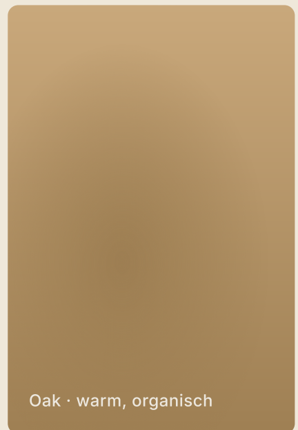
Oak · warm, organisch