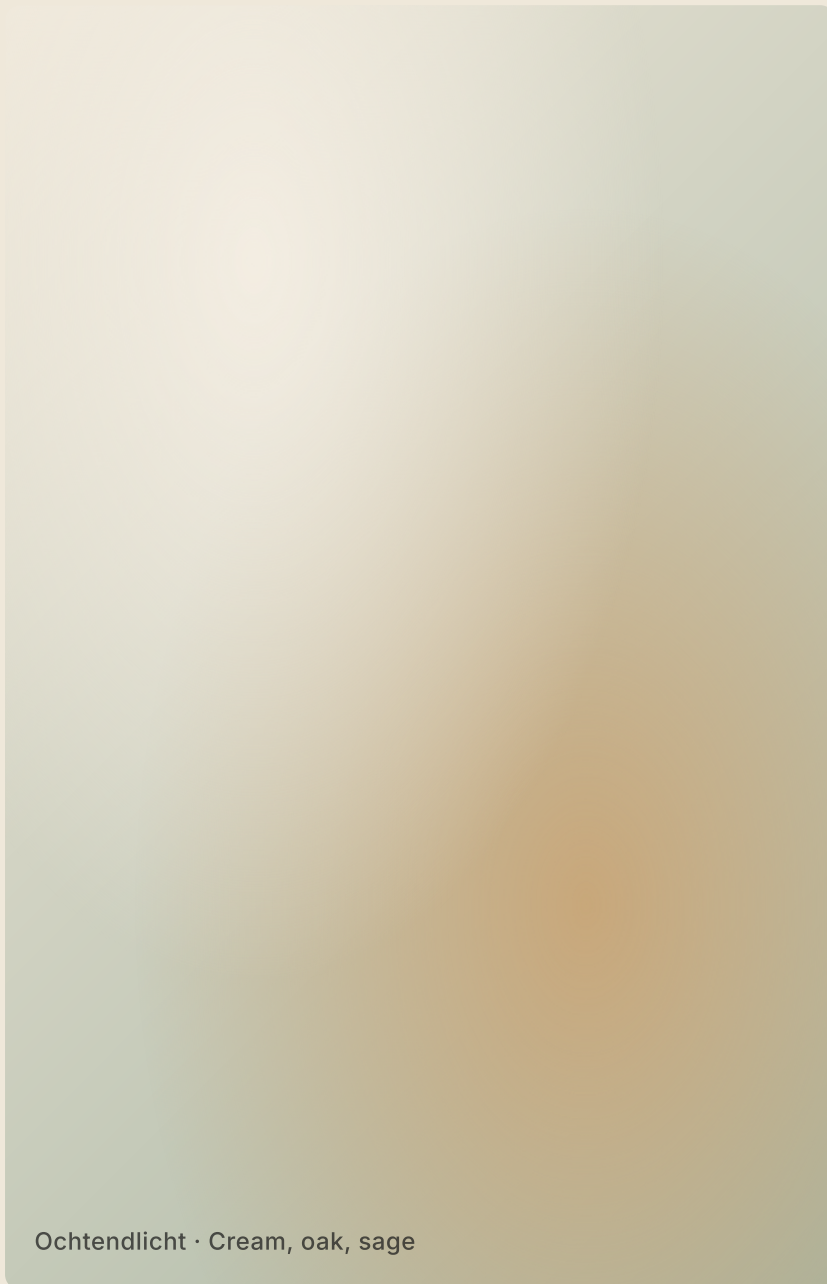
Ochtendlicht · Cream, oak, sage